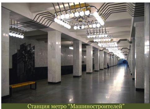
Станция метро "Машиностроителей"

В центре города много скульптур. Кажется, это называется «городская скульптура»: забавные фигурки из металла стоят прямо на тротуарах, без пьедесталов и подиумов.